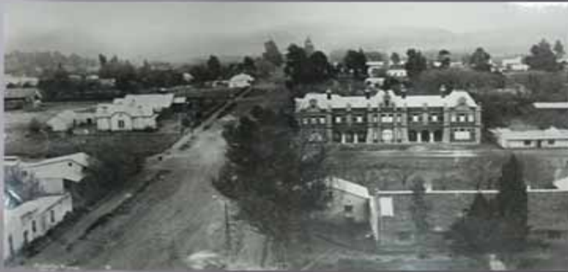
VERMEULENSTRAAT VANAF KERKPLEIN