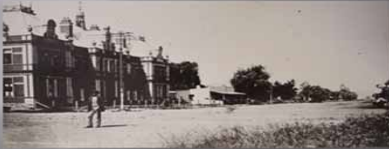
VERMEULENSTRAAT VANAF MARKSTRAAT